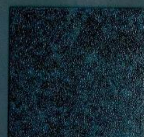
rena schwarz-blau | RE 128 C | 4100 x 600 mm