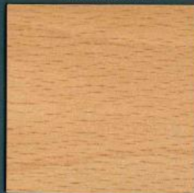
buche gedämpft | Bu 95 PoF | 4100 x 600 mm 4100 x 900 mm