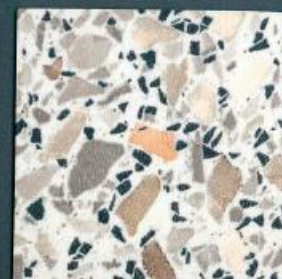
mosaik carmin | MK 432 | 4100 x 600 mm