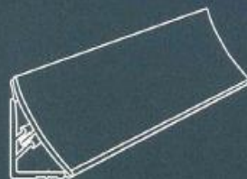
| Wandanschluss-System PLUS | 4100 mm x 20 x 30 mm AH 733