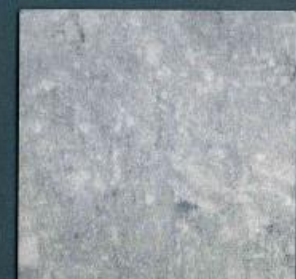
freestone grau | FR 418 C | 4100 x 600 mm