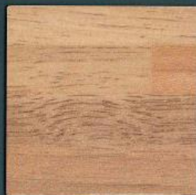
feinstab butcherblock dunkel | WS 673 Fb | 4100 x 600 mm