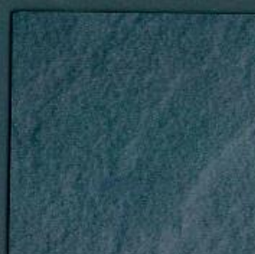
porto schiefer | SC 475 Pe | 4100 x 600 mm