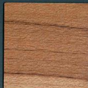
kernahorn | AH 733 PoF | 4100 x 600 mm