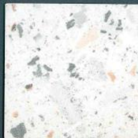
lucca hellgrau | LU 297 C | 4100 x 600 mm