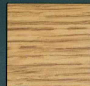
bohleneiche spiegel hell | EB 308 PoD | 4100 x 600 mm