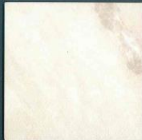
salome manila | SL 239 C | 4100 x 600 mm