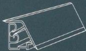
| Wandanschluss-System COMPACT | 4100 mm x 27 x 35 mm Dekorabhängig