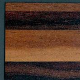
listone butcherblock maron | BBL 329 PoF | 4100 x 600 mm