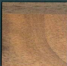
nussbaum butcherblock | NU 742 PoF | 4100 x 600 mm