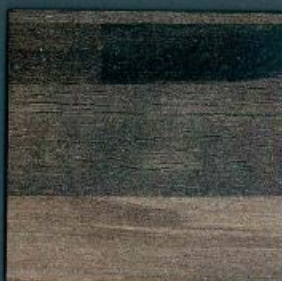
listone butcherblock wenge | BBL 739 PoF | 4100 x 600 mm