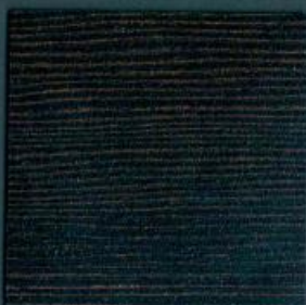
pinie modern | Pi 773 PoF | 4100 x 600 mm