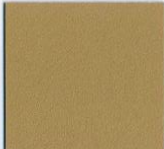
D 2632 PE Messing Stärke: 19 mm