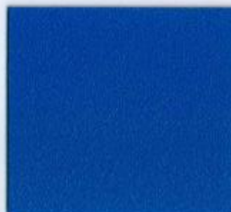
U 125 PE Altblau Stärke: 19 mm