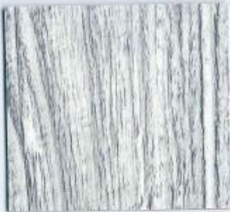
D 1785 RF Canyon Lodge Pine Stärke: 19 mm