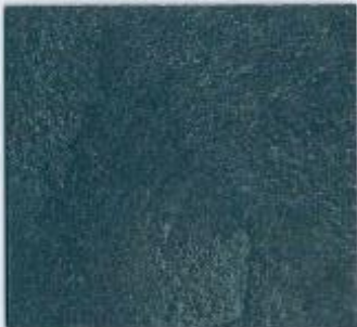
D 2813 VL Schiefer Stärke: 19 mm