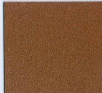
D 2633 PE Bronze Stärke: 19 mm