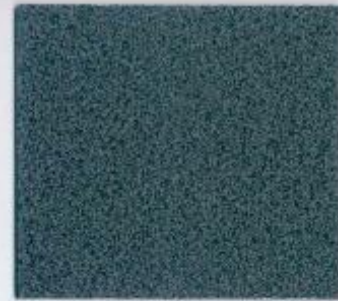
D 495 PE Elysée Stärke: 19 mm