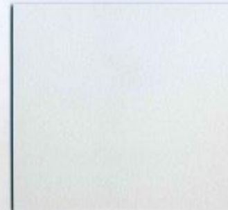
U 191 PE Korpusgrau Stärke: 19 mm