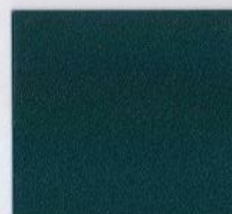
U 164 PE Anthrazit Stärke: 19 mm