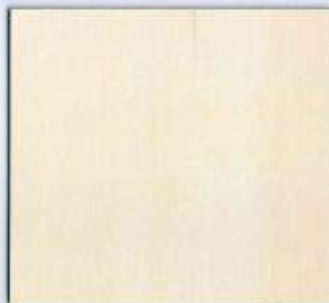
D 327 BS Birke Stärken: 8, 19 mm