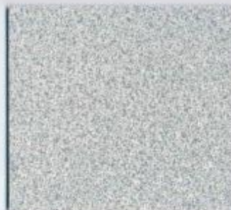
D 494 PE Concorde Stärke: 19 mm