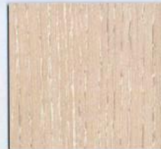
D 2577 VL Taormina Esche Nobel Stärke: 19 mm