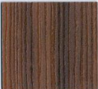
D 7935 SD Wallis Zweischoige Stärke: 19 mm