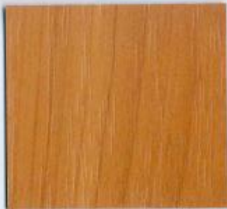
D 340 PR Oxford Kirsche Stärke: 19 mm