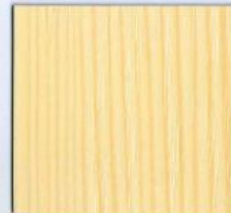
D 355 PR Prie Stärke: 19 mm