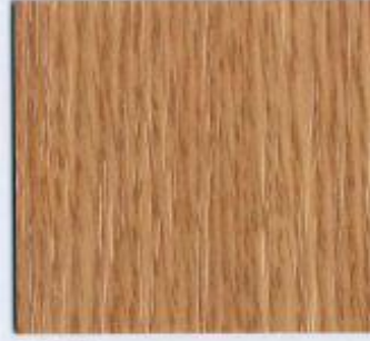
D 740 PR Eiche Hell Stärken: 8, 19 mm