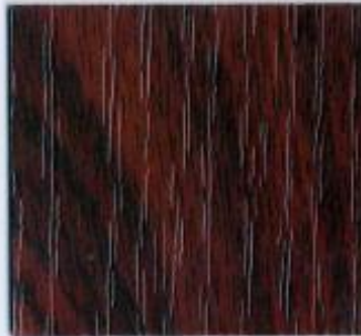
D 776 PR Mafagoni Stärke: 19 mm