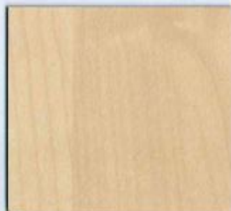
D 375 BS Ahorn Natur Stärken: 8, 19, 22, 28 mm