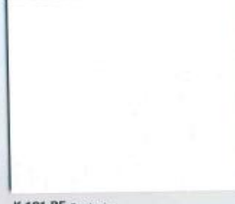
K 101 RF Frontweiss Stärke: 19 mm