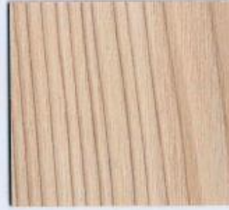
D 1357 NA Tauern Lärche Stärke: 19 mm