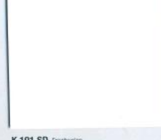
K 101 SD Frontweiss Stärke: 19 mm