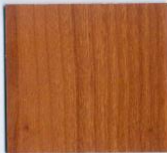
D 1361 BS Nevada Kirsche Stärke: 19 mm