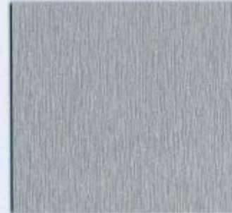
D 1309 WF Aluminium Stärke: 19 mm