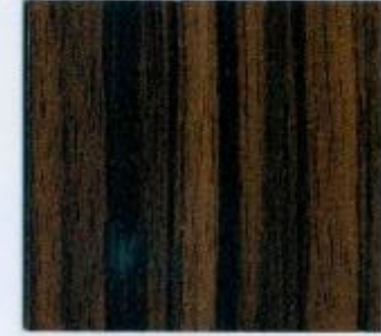
D 2441 BS Makassar Stärke: 19 mm