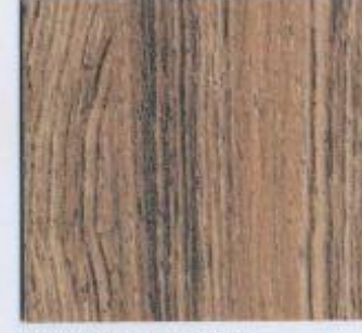
D 2491 VL Jacaranda Rauchton Stärken: 19 mm