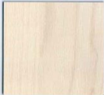
D 2533 NA Golland Ahorn Stärken: ● 19 mm