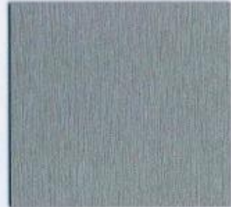
D 853 WF Titan Stärken: 8, 19 mm