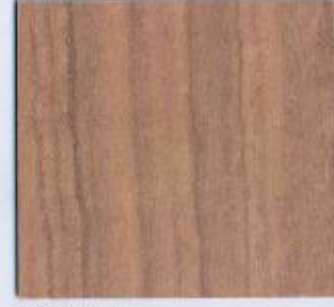
D 2492 VL Pflaume Stärke: 19 mm