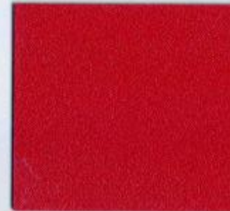
U 148 PE Korallrot Stärke: 19 mm