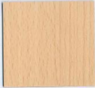
D 451 BS Samerberg Buche Stärken: 8, 19, 22, 26 mm