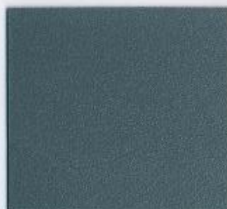
U 162 PE Graphit Stärken: 8, 16, 19 mm