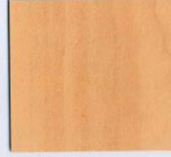
D 991 BS Trentino Apfel Stärken: 8, 19 mm