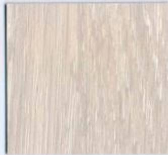
D 701 PR Eiche Diamant Stärke: 19 mm