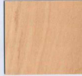
D 1352 BS Wikibirne Natur Stärke: 19 mm