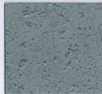
D 2830 VL Beton Anthrazit Stärke: 19 mm