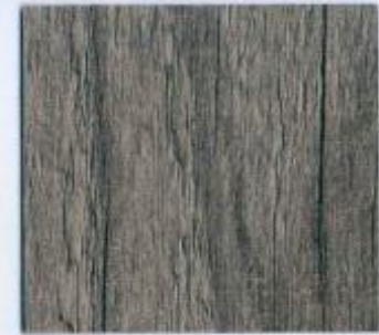
D 2523 RF Kieler Moderne Stärke: 19 mm