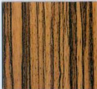
D 2284 BS Zobrano Stärke: 19 mm