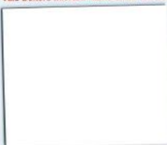
K 101 SM Frontweiss Stärken: 8, 16, 19 mm

Alle Dekore mit ABS Kante 2 mm und SK-Kante