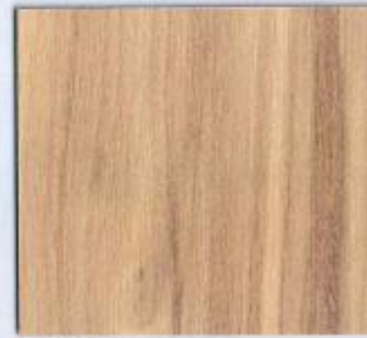
D 1246 NA Plateau Apfel Natur Stärke: 19 mm