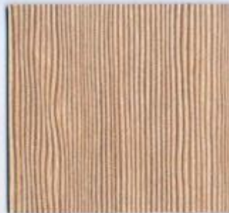
D 2383 VL Zeder Hell Stärke: 19 mm