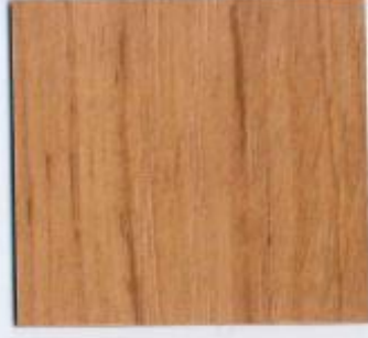
D 620 PR Roterle Stärke: 19 mm