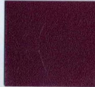
U 2540 PE Malve Stärke: 19 mm