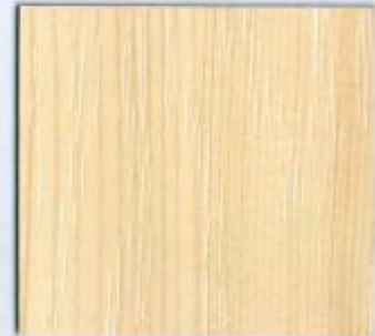
D 396 PR Astfichte Stärke: 19 mm