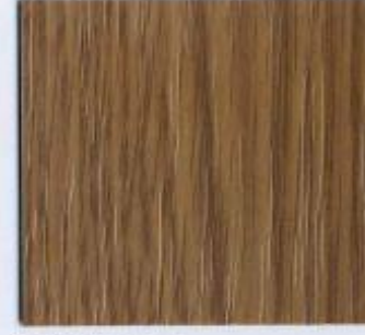
D 741 PR Eiche Dunkel Stärken: 8, 19 mm