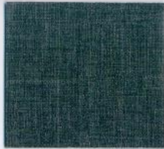
D 2566 PE Twist Stärke: 19 mm