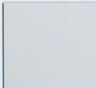
U 112 PE Grau Stärken: 8, 13, 16, 19, 22, 28 mm