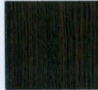
D 854 BS Wenge Stärke: 19 mm