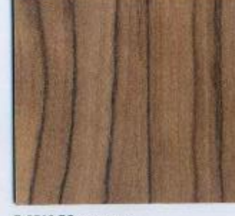
D 2513 BS Sevilla Olive Stärke: 19 mm