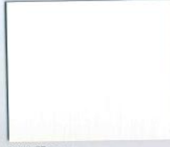
K 101 SE Frontweiss Stärke: 19 mm