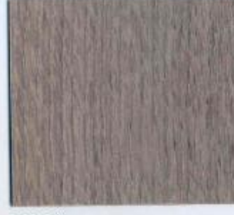
D 2216 VL Chamorix Eiche Stärke: 19 mm