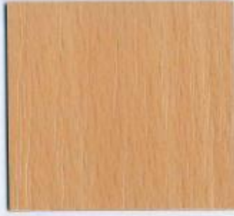
D 381 PR Buche Stärken: 8, 19 mm